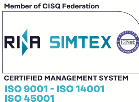
Figura 2.a (varianta color)

Exemplu 2: Marca de conformitate pentru sistemul de management integrat calitate/mediu/SSM