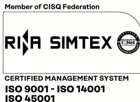
Figura 2.b (varianta alb-negru)

Organizatia certificata este libera sa aleaga si sa foloseasca oricare dintre cele doua variante (cea pentru tipar color si/sau cea pentru tipar alb-negru).