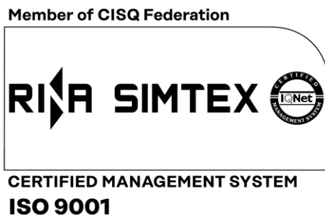
Figura 1.b (varianta alb-negru)